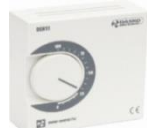
Rys. 1. Nastawnik DEN 11.

Nastawnik DEN 11 jest pomieszczeniowym nastawnikiem prędkości obrotowej wentylatorów z ograniczeniem minimalnego i maksymalnegoysterowania. Regulacja obrotów dokonuje się poprzez zmianę położenia potencjometra w zakresie 0-100% (zakres napięciowy 0-10VDC).