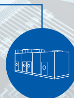
małe centrale wentylacyjne